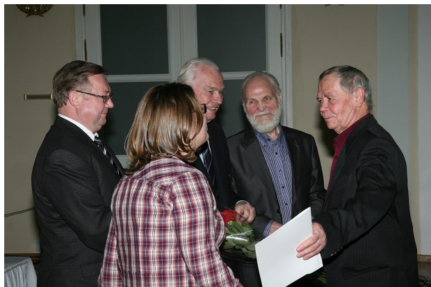
Церемония вручения Большой литературной премии России за 2011 год. 1 декабря 2011 года